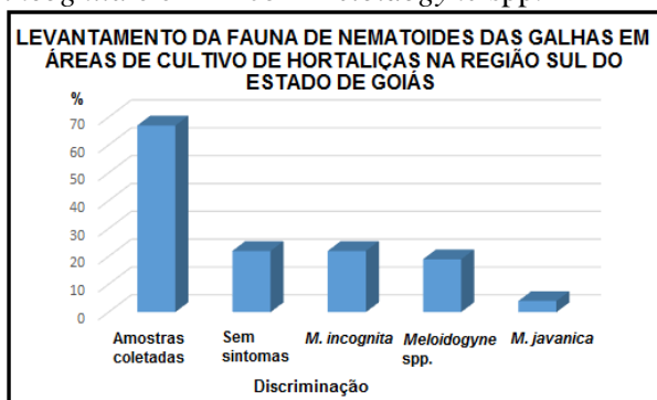
Figura 1 – Percentagem de amostras coletadas sem, com sintomas e as espécies ocorrentes na Região Sul do Estado de Goiás.

Foram coletadas 23 amostras na cultura de alface, sendo que 16 apresentaram sintomas das galhas, sendo encontrados em 3 com M. incognita e em 12 com Meloidogyne spp.