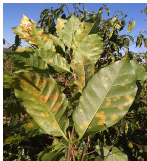
Figura 1. Folha de cafeeiro com sintomas de ferrugem.

A ferrugem do cafeeiro causada pelo fungo Hemileia vastatrix (Figura 1) é a principal doença do cafeeiro em todo mundo, especialmente no Brasil. O patógeno tem a capacidade de infectar tanto o café Conilon ( Coffea canephora ), quanto o Arábica ( C. arábica ). A queda precoce das folhas resulta em menor vingamento da florada, menor vingamento dos chumbinhos e também seca dos ramos plagiotrópicos, comprometendo, em alguns casos em mais de 50%, a produção do cafeeiro. Os urediniósporos são as unidades propagativas e infectivas que darão início a surtos epidêmicos (Zambolim et al., 1997).